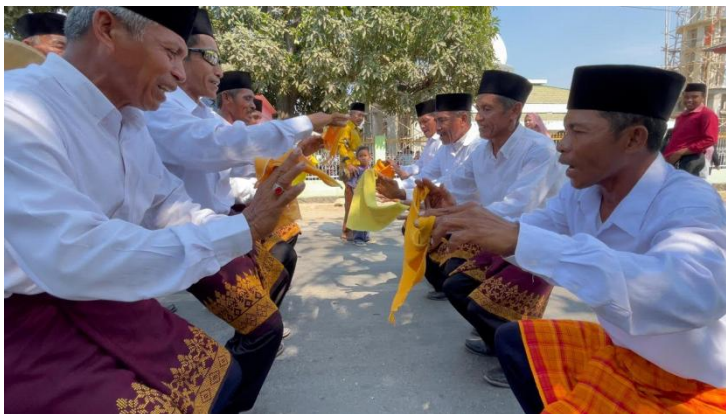
Gambar 1. Anggota Hadrah Berjumlah 9 Orang

Berdasarkan Gambar di atas, maka dapat dijelaskan bahwa yang terlibat langsung dalam prosesi acara ada berjumlah 9 orang laki – laki dewasa yang berpakaian seragam baju putih lengan Panjang dan celana panjang berwarna Hitam dilingkari dengan sarung bermotif tradisional Bima, 3 orang atau lebih dianjurkan untuk memegang sputangan berwarna kuning sambil mengempaskan kain tersebut diiringi dengan zikir hadrah, 3 orang lainnya bertugas untuk memainkan alat musik tradisional yaitu Hadrah.